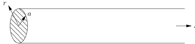
Figur 2: En lang, sylindrisk leder.