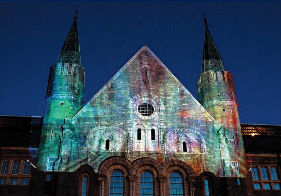
Trykk: NTNU Grafisk senter 2016