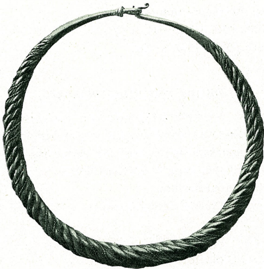
Fig. 1. \frac{1}{2} .

Fundet maa opfattes som et markfund eller skattefund og ikke som gravfund.