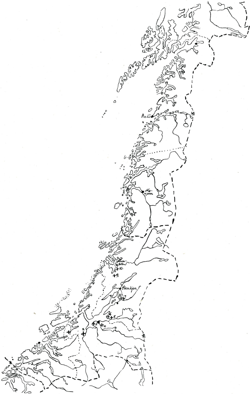
Oversigt over kufiske myntfund i det nordenfjeldske Norge. Hvert findested er merket med +.