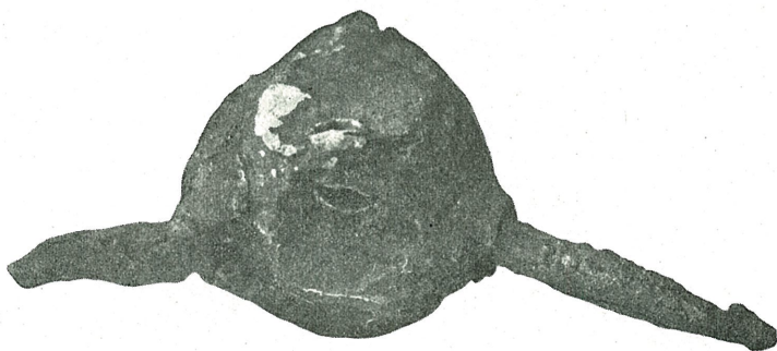
Fig. 2. \frac{1}{1} .

Den bestaar av en uregelmæssig kugleformet kjerne av bly c. 4 cm. i tvermaal, hvori har været indstøpt 5 pigger av jern. Av disse er kun tre bevaret i sterkt forrustet tilstand. De er fra 3,5—4 cm. lange og som det endnu sees paa to av dem, har de været forsynet med mothaker paa begge sider. Fire av disse spidser har været fæstet i kuglens ene halvdel, nemlig de tre bevarede og en fjerde, hvorav der nu kun sees forrustede rester i blyet. De har været anbragt omtrent parvis, saaledes at to peker skraat nedad til den ene side, nu næsten parallelt, men det kan tydelig sees at den ene spids er høiet indad, og at de oprindelig har spriket ut fra hinanden. Den tredie er anbragt symmetrisk paa den motsatte side, og den fjerde ikke langt derfra; den maa ogsaa ha pekt skraat nedad. Av den