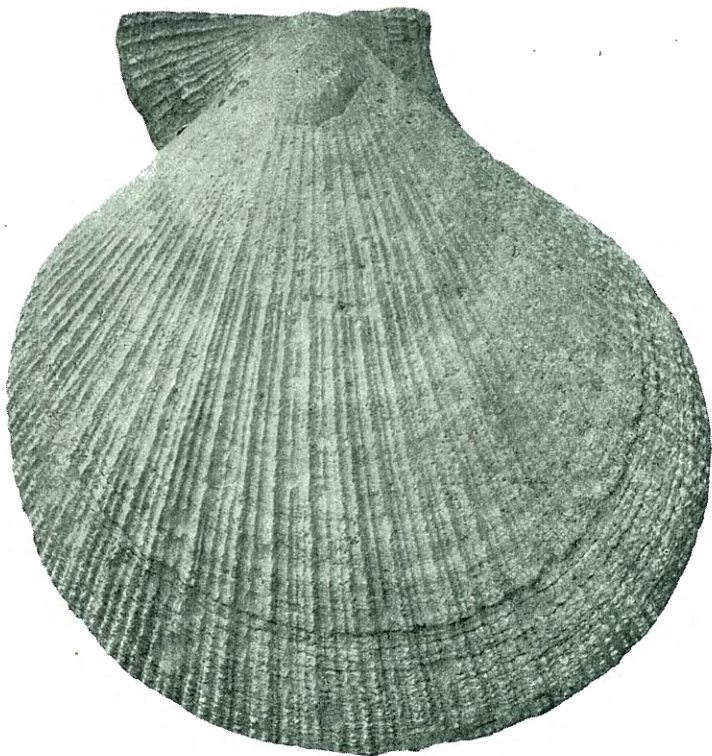
Fig. 3. Pecten islandicus MÜLL. \frac{1}{4} . Vinjeøren.

SARS tat enkelte eksemplarer op til Lofoten, men derimot ikke ved Finmarken. Den er saaledes en vest- og sydeuropæisk art. I former omtrent som ved Vardalsbækken er den f. eks. fundet ved Göta elfs utløp (Göteborg), og noget mindre ved Otraly og Bergendal (Kristianssand), Borgestad (Porsgrund), Ranesklev (Romsdalen), Gautmoen (Bindalen) og Valle teglverk mellem Sarpsborg