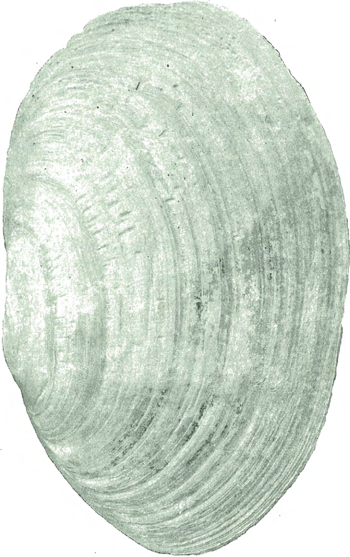
Fig. 8. Lutraria elliptica LAMK. \frac{1}{4} l. Bolgen, Freiø (Nummedal leg.)

banker ved Aamdalsstrand og Haugane (Nordsjø), likesom ogsaa, som ovenfor nævnt, i det trondhjemske i de to fremtrædende