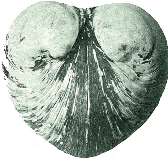
Fig. 6. Isocardia cor LIN. 1 / 4 . Tangen teglverk, 3 m. u. overflaten, Stjørdalen.

Isocardia cor Lin. forekom omkring Langbækken nær Gula