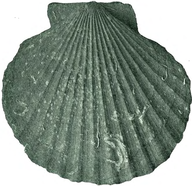
Fig. 2. Pecten opercularis LIN. \frac{1}{1} . Mære, Sparbu.

dersøkelse af hans originalmateriale viste det sig at være den store form af Pecten opercularis , som ogsaa er kjendt fra flere andre steder, saaledes Stenkjær, Smulem, Mære, Ranesklev, Skjellebæk, Borgestad, Kalstادتjern, Lærumskredet, Valle, Gjermstad. Som nemlig det i M. SARS's samling opbevarte eksemplar viser, er hans angivelse af Vola maxima LIN. fra Stenkjær teglverk feilagtig, idet det opbevarte, defekte eksemplar viser sig at tilhøre en forholdsvis stor form af P. opercularis , af h ide 75 mm., men af normal formtype. Det samme er ogsaa tilf eldet med