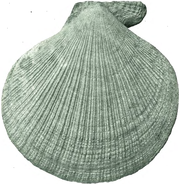
Fig. 4. Pecten islandicus MÜLL. \frac{1}{1} . Vinjeøren.

selv har jeg fundet den samme formtype mellem Portobello og Leith i nærheten af Edinburg (Skotland). Endvidere er P. opercularis fundet f. eks. ved Fredriksstad og Gudeberg teglverker (Fredriksstad), Jordal teglverk (Kristiania), i Tapes-niveaueis banke ved Hvalstادتunellen (Asker), og recente eksemplarer er sendt mig af DANIELSEN fra Hassalviken (Askerøen) og af cand. NIS-