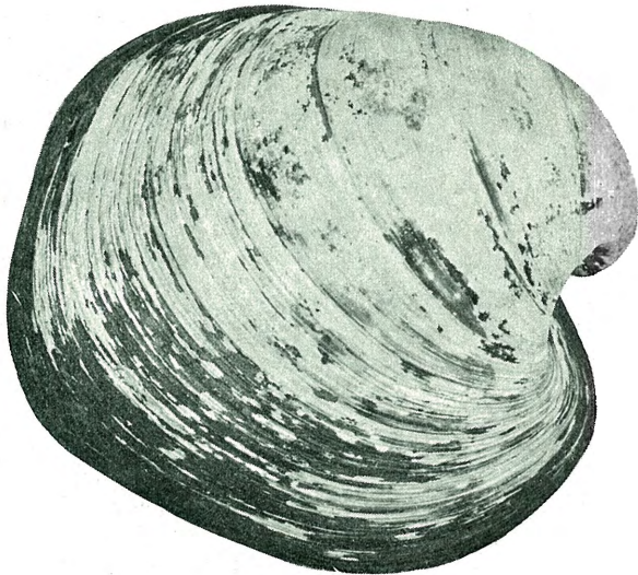
Fig. 7. Isocardia cor LIN. \frac{1}{4} . Tangen teglverk, 3 m. u. overflaten, Stjørdalen.

Cyprina islandica LIN. forekom ved Vollan i samme formtype som i Hevne, ved Berhals (Vinjøren, 73 m. o. h.), Storhaug (Hevne 73 m. o. h.), Ørlandet (M. SARS), Røne-Aune (Ørlandet), Hovs utmark, Størset, Baklandets teglverk, Iilsviken, Reitgjerdet,