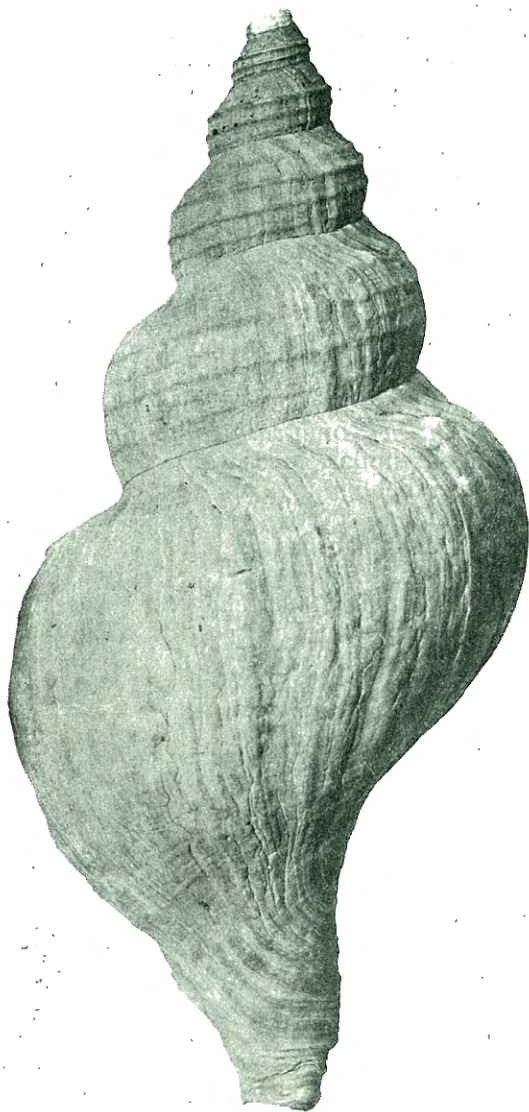
Fig. 12. Neptunea despecta LIN. \frac{1}{4} . Vardalsbækken, Fallenelven.

det), tildels i varieteter som ogsaa er fundet i Kristianiafeltet, f. eks. ved Moss-teglverk og paa Rauer.