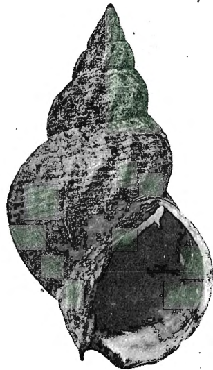
Fig. 11. Buccinum undatum . LIN. 1/1. Indbryn, Stod

skjælbanke ved Engelsvik (Onsø), og heller ikke fra den form, som jeg har tat levende ved Lerwick (Shetlandsøerne). Vagre former, men tildels i noget afvikende varieteter, har jeg samlet paa Kirkestappen og Sandholmen (Gjesvær).