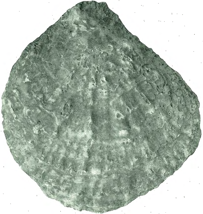
Fig. 1. Ostrea edulis LIN. \frac{1}{4} . Vardalsbækken, Fallenelv.

to arter og, som nu i det efterfølgende omtalt, gjør det samme sig gjeldende i det trondhjemske. Denne art anføres af M. Sars (F. D. Q., pag. 78) fra Tronstad (Haaøen, Drøbak) og forekommer der i en formtype, der fuldstændig svarer til den, som jeg ogsaa har fundet i Etterstadskjæringen (Kristiania). I bestemmelsen af denne art følges Brocchi f. eks. af Lovén.