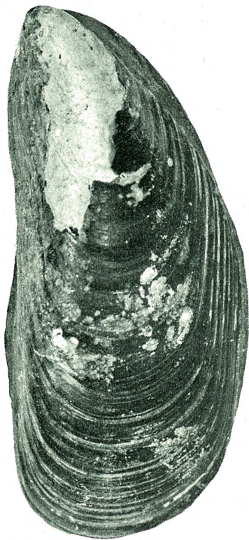
Fig. 5. Mytilus edulis LIN. 1 / 1 . Nær elven, Morset, Hegre.

vata . Den sidder i størst masse på bratte bergvægge, hvor søtræer ikke stå, saaledes f. ex. lige udenfor Gjedenesset, hvor jeg i kort tid opfiskede flere hundrede og indt. 70 stykker ved en enkelt skrabning, men forøvrigt overalt i bergbakkerne, også ved sin byssus fæstet til oculiner fra 120 F. og nedover, i Skarnsundet ved 60 F. D.» (Oversigt over Trondhjemsfjordens Fauna,