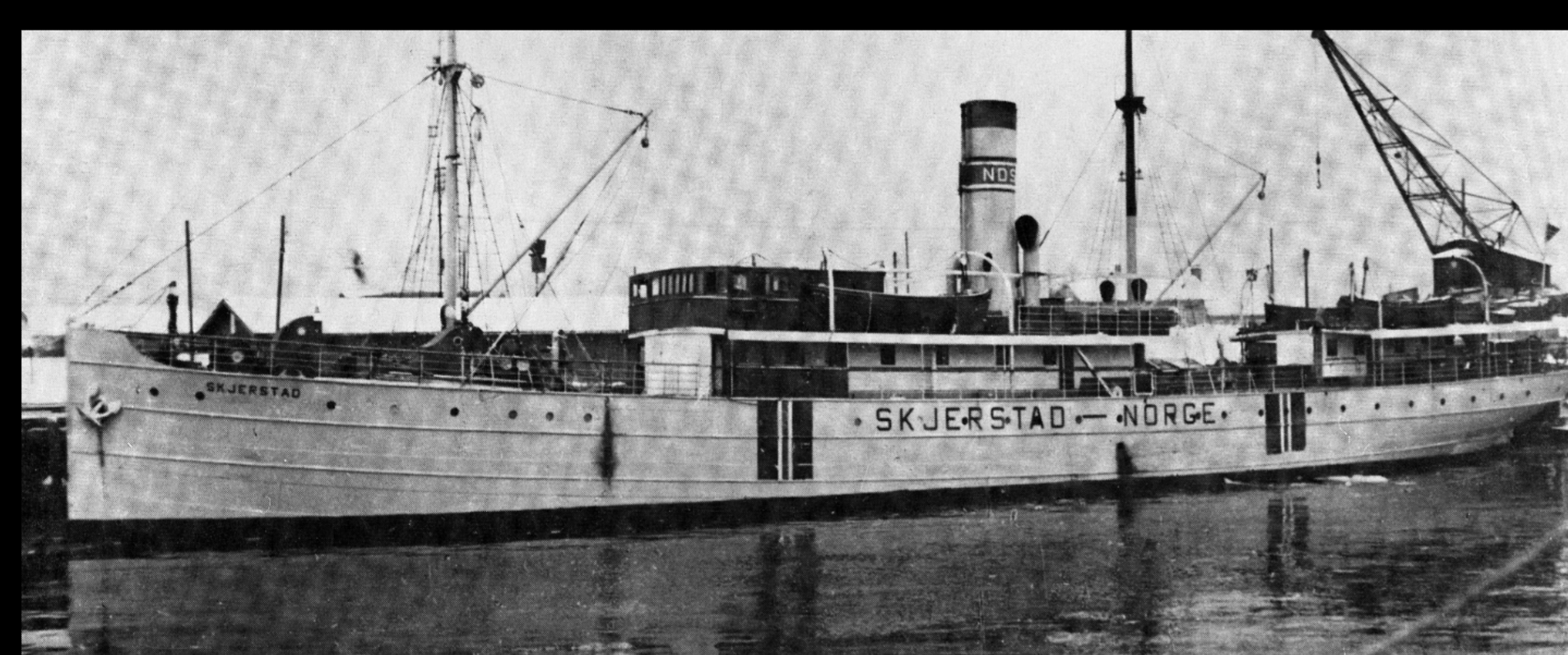
D/S Skjerstad