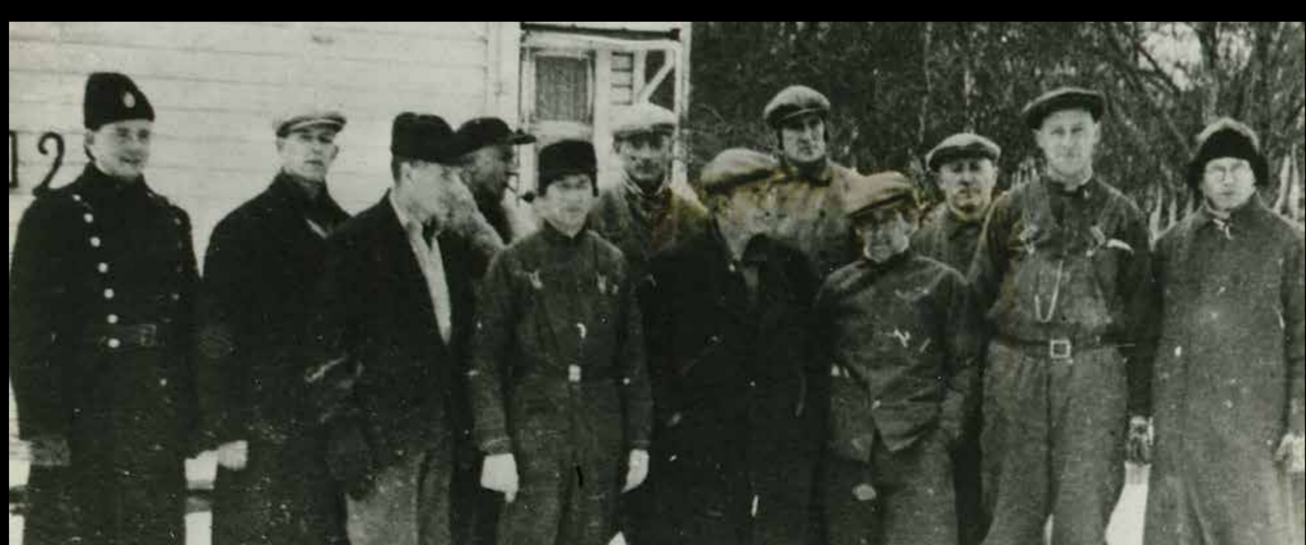
Arresterte lærere i Kirkenes