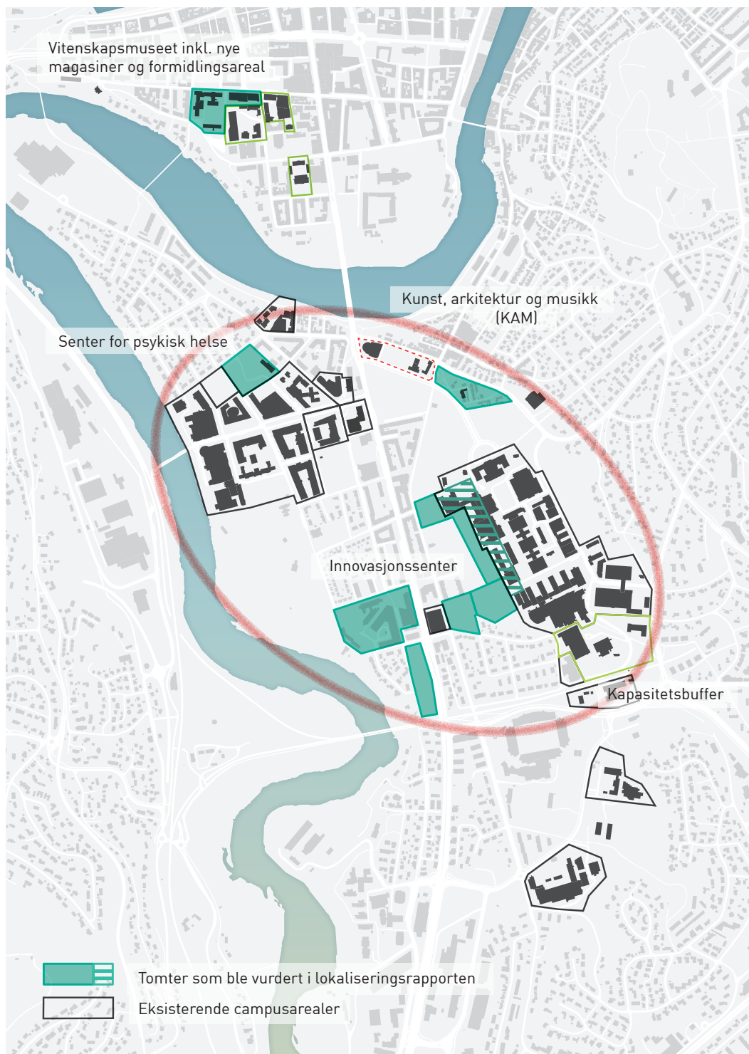
Kart fra lokaliseringsrapporten